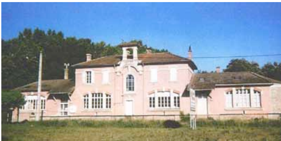
l'école de Galas